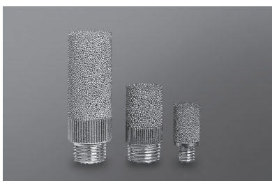
Tłumiki z brązu spiekanego, z gwintem